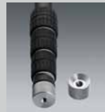
Verbindungs-knopf f. QLEG Fuß M 10 / 1/4" Connector for QLEG bottom M 10 / 1/4" QP RED M 10