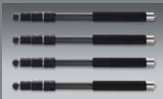
4 St. QuadroLeg, Carbon, 4 Segmente 4 pcs. QuadroLeg, carbon, 4 segments QLEG C2840 SET