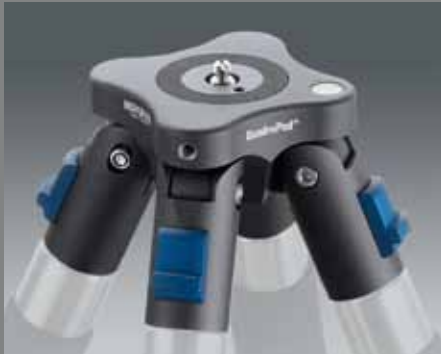
QuadroPod Basic QP B QuadroPod Basic QP B