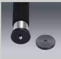
Einbein-Stativaufsatz für QLEG Monopod plate for QLEG QP MONO