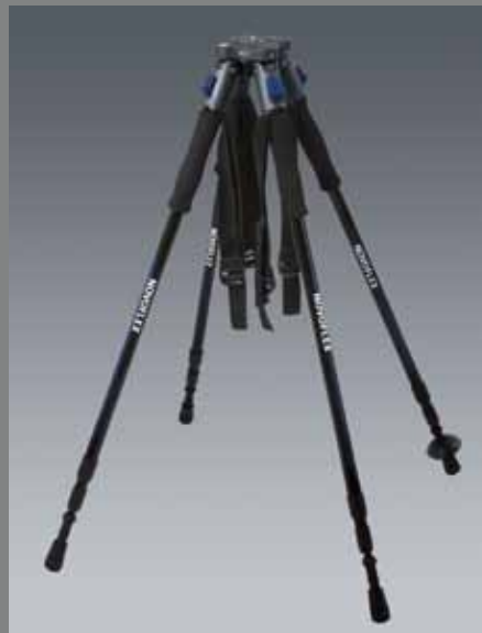
QP B Q LEG A1830 Walk SET