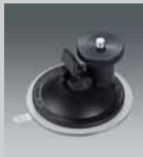
Saugstativ Suction pod SP