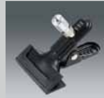
Große Klemme Big Clamp KLEMMME