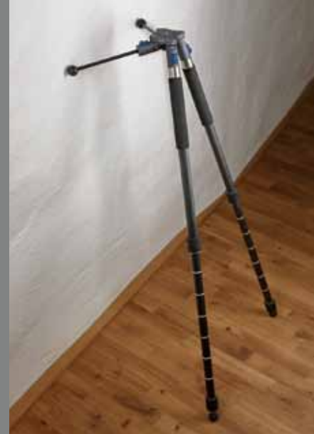
QP B 2 Q LEG C2830 2 Q LEG A1010 Mini