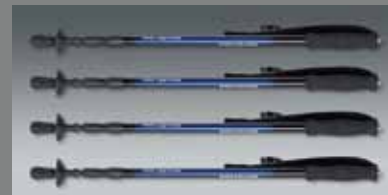
4 St. QuadroLeg, Wanderstock 4 pcs. QuadroLeg, walking stick QLEG A1830 Walk SET