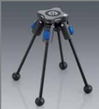
QP B Q LEG A1010 Mini SET