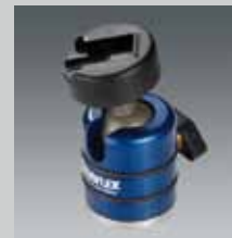
Kugelneiger mit Blitzschuh Small ball head with flash-shoe NEIGER 19