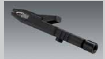
Halteklemmer Mini Clamp KLAMMER