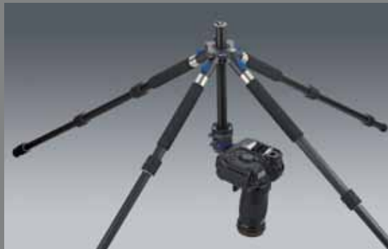
QP C Q LEG A2840 SET ClassicBall CB 3 (Repro-Stellung / Repro position)