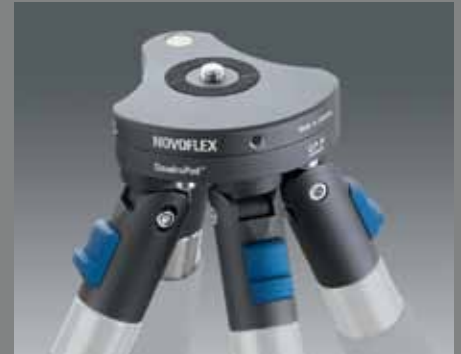
QuadroPod Variabel QP V QuadroPod variable QP V