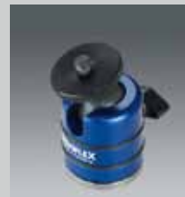
Kugelneiger mit Aufлагeteller Small ball head with plate BALL 19