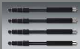
4 St. QuadroLeg, Aluminium, 4 Segmente 4 pcs. QuadroLeg, aluminum, 4 segments QLEG A2840 SET