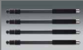
4 St. QuadroLeg, Carbon, 3 Segmente 4 pcs. QuadroLeg, carbon, 3 segments QLEG C2830 SET