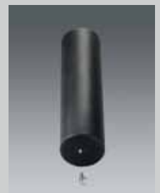
Reprostange für QuadroPod 15 cm Repro rod for QuadroPod 5.9" MS-REPRO-VL