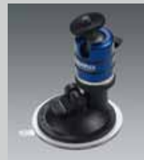
Saugstativ + BALL 19 Suction pod + BALL 19 SP STATIV