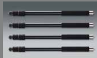
4 St. QuadroLeg, Aluminium, 3 Segmente 4 pcs. QuadroLeg, aluminum, 3 segments QLEG A2830 SET