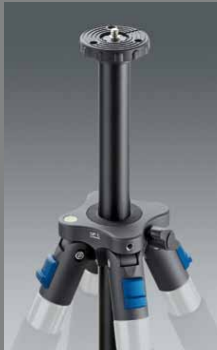
QuadroPod mit Mittelsäule QP C QuadroPod with center column QP C