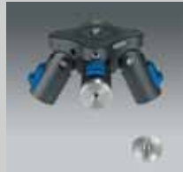
1/4" Verbindungsstück 1/4" connector QP RED 1/4"