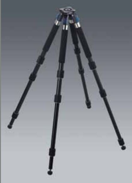
QP B Q LEG A2840 SET