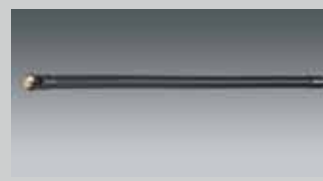
Flexibler Arm 45 cm flexible arm 17.7" ARM