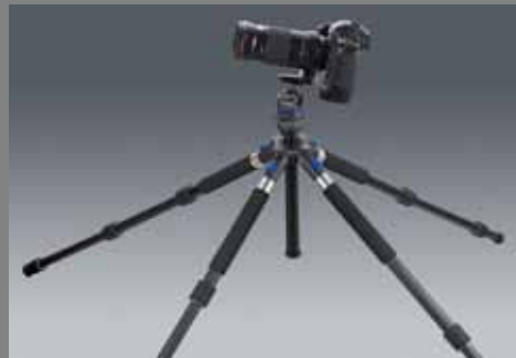
QP C Q LEG A2840 SET CB 3