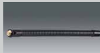
Kurzer flexibler Arm 26 cm short flexible arm 10.2" ARM-K