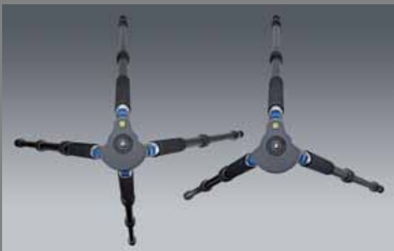
QP V Q LEG A2830 SET