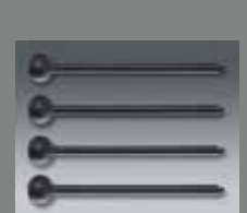
4 St. QuadroLeg, Mini 4 pcs. QuadroLeg, mini QLEG A1010 Mini SET