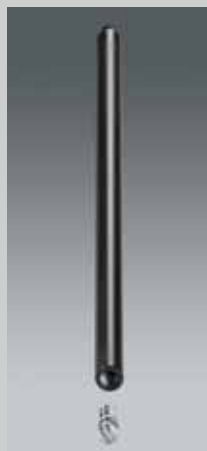
Stange 15 cm oder 30 cm Extension rod 5.9" oder 11.8" STA 15 | STA 30