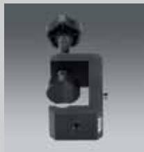
Klemmstativ 42 mm Spannweite Clamp mount 1.65" UNIKLEM 42